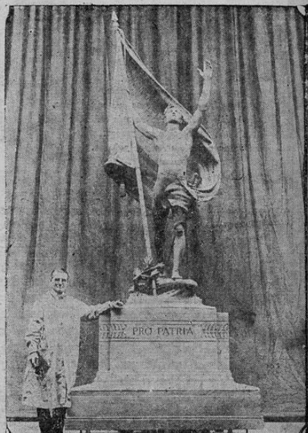
Este monumento, el más grande construido de bronce en los Estados Unidos, ha sido erigido en memoria de los ciudadanos de Indiana que cayeron en la guerra europea. Es obra del escultor Henry Hering, quien aparece al lado